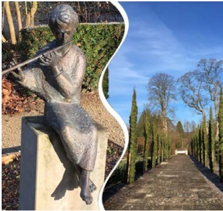
Der Kurpark in Bad Pyrmont