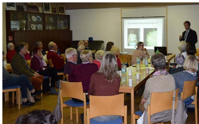
Teilnehmer am Vortrag zur Osteoporose

Vier Mal im Jahr steht das Leitungsteam motiviert und mit Freude für Informationen und Austausch in Bezug auf Erkrankungen aus dem rheumatischen Formenkreis bereit. Das Besondere daran ist, dass jede Informationsstunde auf einem Schwerpunktthema fokussiert ist und mit einem Sachreferat abgerundet wird. Für unsere letzte Infoveranstaltung in 2018 haben wir das Schwerpunktthema Osteoporose in den Mittelpunkt gestellt. Wir