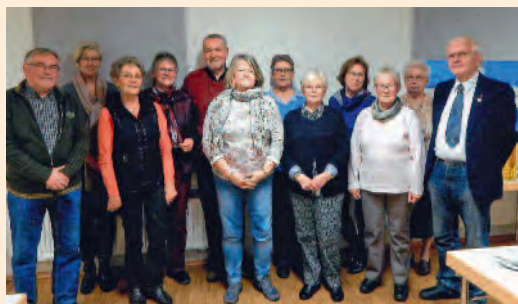
Ehrungen der AG Osnabrück